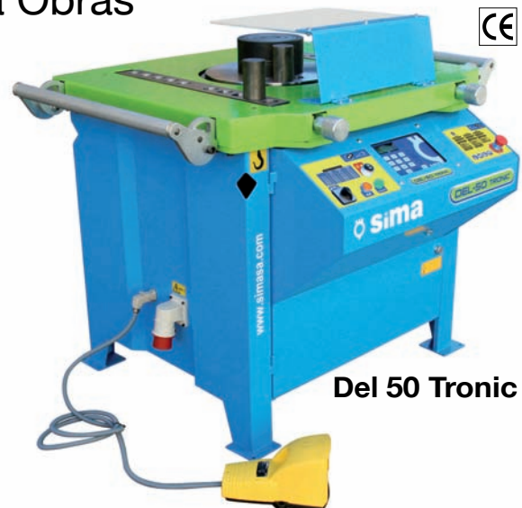
Del 50 Tronic