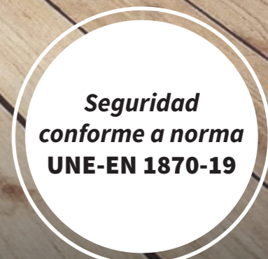
Seguridad conforme a norma UNE-EN 1870-19