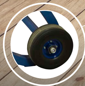
Ruedas de 250mm poliuretano, impinchables