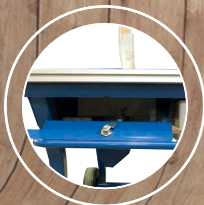
Compartimento para herramientas