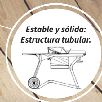
Estable y sólida: Estructura tubular.