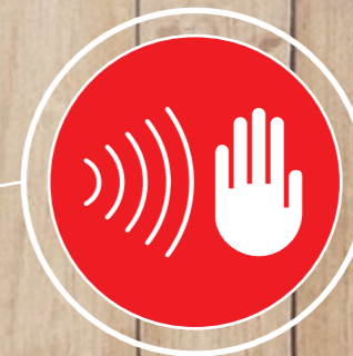
Sensor ISS de detección de manos