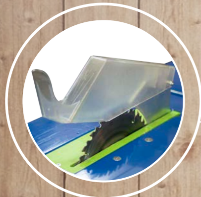
Carcasa protectora de disco