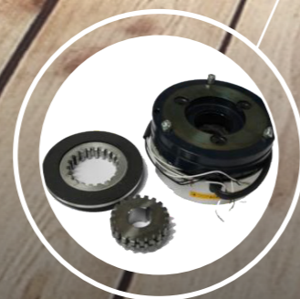
Freno motor (<1 seg.)