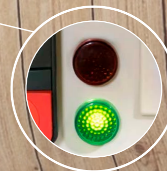
Testigos luminosos de funcionamiento del sistema